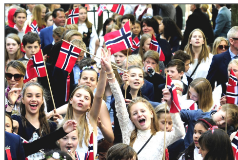
Norge är det land i världen som har högst BNI per capita.

Det visar hur mycket pengar invånarna i landet har att handla för. Men det säger ingenting om hur inkomsterna är fördelade.