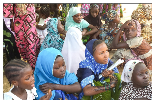
Niger är det land i världen som har lägst HDI.

Av de länder som har lägst HDI i världen, ligger så gott som alla i Afrika.