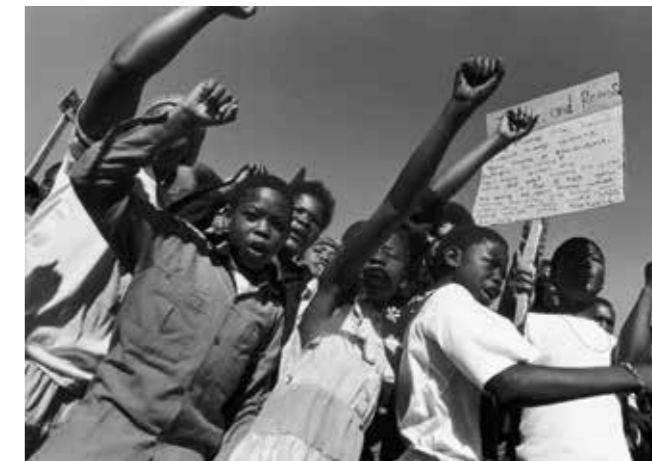
Protest mot apartheid i Soweto. Sydafrika, 1989.

Efter boerkriget fick områden i Sydafrika med vit befolkning självstyre, och boerna fick stort inflytande i politiken. Den vita minoriteten ägde 87 procent av all jord. De svarta förbjöds att rösta och ha kvalificerade yrken. Dessutom förbjöds äktenskap mellan vita och svarta. Raslagarna ledde till apartheid, ett politiskt system som skiljde svarta och vita åt.