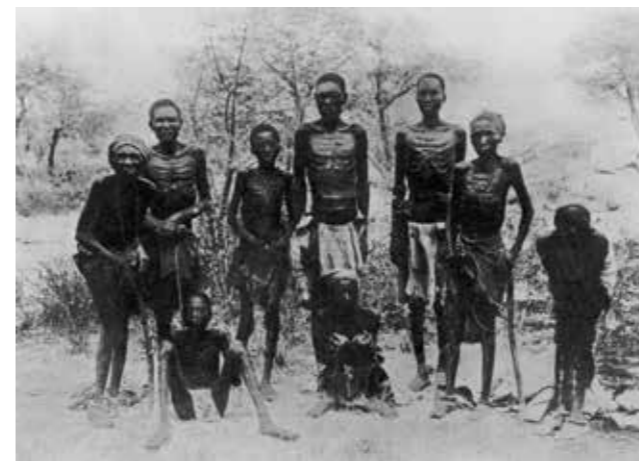
En grupp herero som har överlevt en tvångsmarsch genom öknen. Namibia, omkring 1904.

Herero- och namafolket sattes bland annat i koncentrationsläger, skickades ut på tvångsmarscher och utsattes för tortyr. Det utfördes experiment på fångar, och terrorkrig fördes mot civila. Det här var metoder som senare användes under Förintelsen. Av hererofolket var det endast 15 000 av en befolkning på 100 000 människor som överlevde.