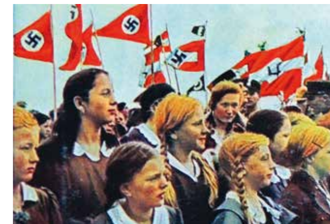
Tyska flickor i Bund Deutscher Mädel (BDM). I bakgrunden nazisternas flagga. Tyskland, 1934.

Nazisterna ordnade stora massmöten där tyskarna översköldes av propaganda. Arbetslösheten minskade, och många tyskar fick det ekonomiskt bättre ställt. Det främsta skälet till den minskade arbetslösheten var den militära upprustningen.