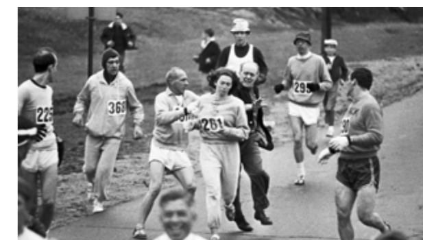
Kathrine Switzer. Boston Marathon, 1967.