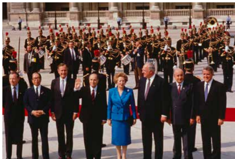
Invigning av det 15:e G7-toppmötet, samma dag som 200-årsjubileet av stormningen av Bastiljen. Margaret Thatcher, Storbritanniens premiärminister, i mitten bland världsledarna. 14 juli, 1989, Paris.