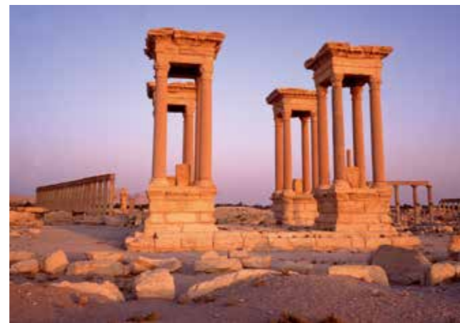
Staden Palmyra, Syrien, från 2000 f.v.t., har haft många härskare, bland annat semiter och romare.

Ytterligare ett sätt att grovt dela in historien är i förhistorisk och historisk tid. Med förhistorisk tid menas den långa tid då det fanns olika människoslag, men som det saknas skriftliga källor från.