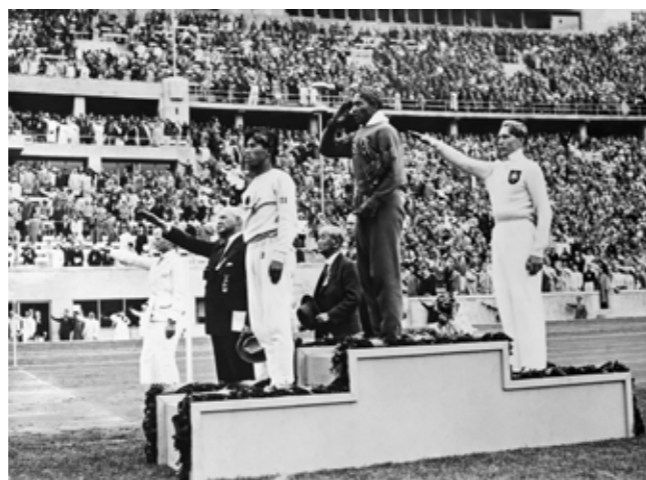
OS. Berlin, 1936.