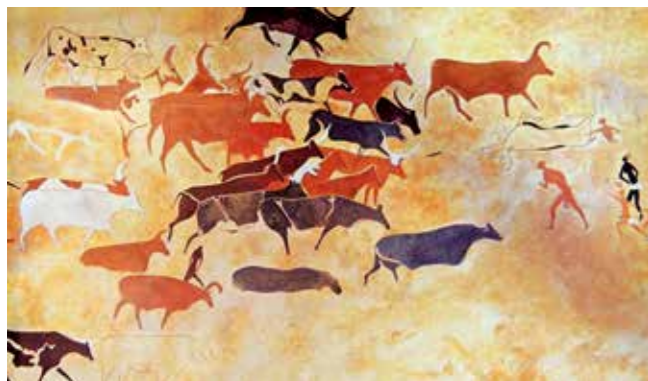
Grottmålning över kojakt från Jabbaren, Algeriet, där de äldsta målningarna är från 10 000 f.v.t.

Ett sätt att dela in historien är efter hur tidiga människor, och till en början även den moderna människan ( Homo sapiens ), försörjde sig. De senaste 40 000 åren har Homo sapiens varit den enda existerande människoslaget på jorden. Från början levde de i jägar- och samlarsamhällen.