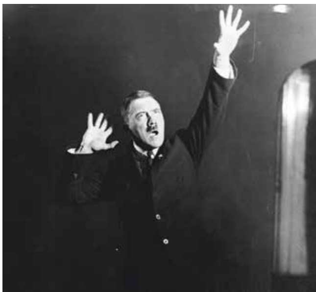
Bild på Adolf Hitler från 1925 när han tränar på olika gester för att förstärka sina tal.

Ledaren, Führern, ska ha mycket makt och dyrkas av folket. Demokrati anses splittra folket som i stället bör enas under sin Führer. Pacifism, att lösa konflikter på ett fredligt sätt, anses försvaga länd-