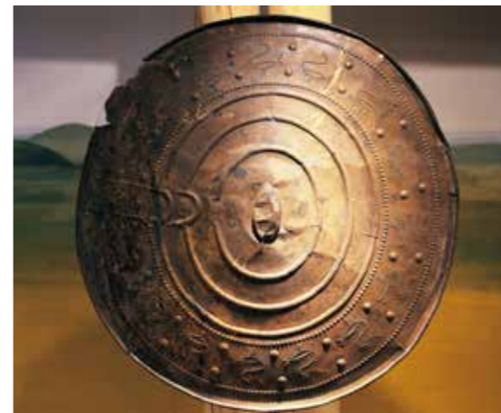
Sköld från nordisk bronsålder. Halland.