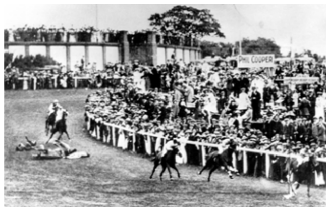
Emily Davison. Epsom, Storbritannien, 1913.