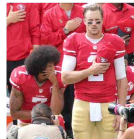
NFL. USA, 2016.