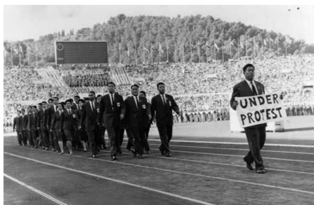
OS. Rom, 1960.