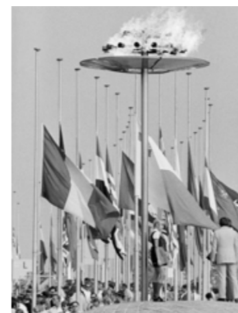
OS. München, 1972.