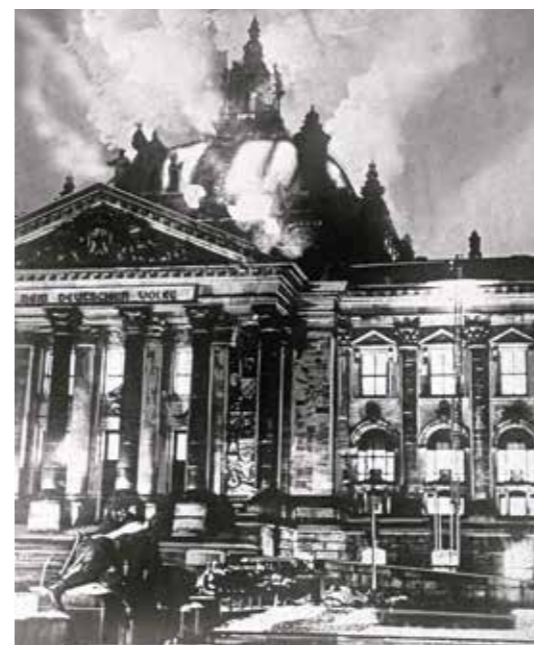
Branden i riksdagshuset. Berlin, 1933.

Demokratin avskaffades, och alla fackföreningar samt alla politiska partier utom nazistpartiet för-