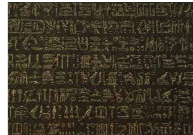
Rosettastenen från Egypten har en 2000 år gammal text skriven på två språk och tre olika alfabet.

Ett områdes historiska tid börjar med det skrivna språket, det vill säga från när det finns skriftliga källor. De äldsta skriftliga källorna som har hittats är från Mesopotamien omkring 3200 f.v.t. och 3150 f.v.t. från Egypten. I Indien finns fynd av skriftspråk från cirka 2500 f.v.t. och i Kina cirka 1600 f.v.t.