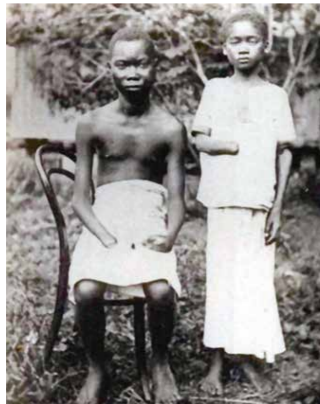
Under det brutala slaveriet i Kongo var stympning av händer ett vanligt straff. Kongo, 1900.

Kongo kallades "Fristaten Kongo". Kongoleserna själva upplevde dock ingen frihet. Kung Leopolds privata armé tvingade den kongolesiska befolkningen att samla in gummi från träden. Om de inte lyckades samla in tillräckligt mycket gummi utdelades brutala straff, såsom piskrapp, misshandel, våldtäkt och stympning av händer och fötter.