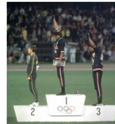
OS. Mexico City, 1968.