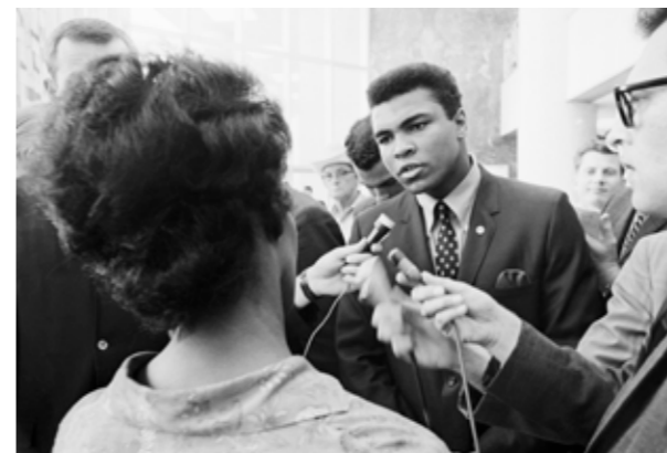
"They never called me n*****"