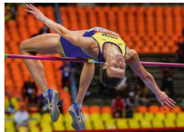
Friidrotts-VM. Moskva, 2013.