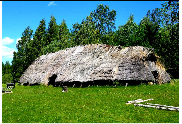
Under järnåldern byggdes stora långhus. Ett långhus kunde vara 30 meter långt.

Det fanns nya husdjur som katter , höns och hästar i byn. Det var barnens arbete att vakta och mata djuren.