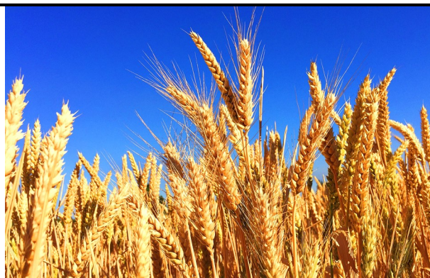
För 6 000 år sedan började man odla vete och korn i Sverige.