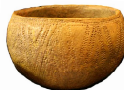
Sädeskornen förvarades i en lerkruka.