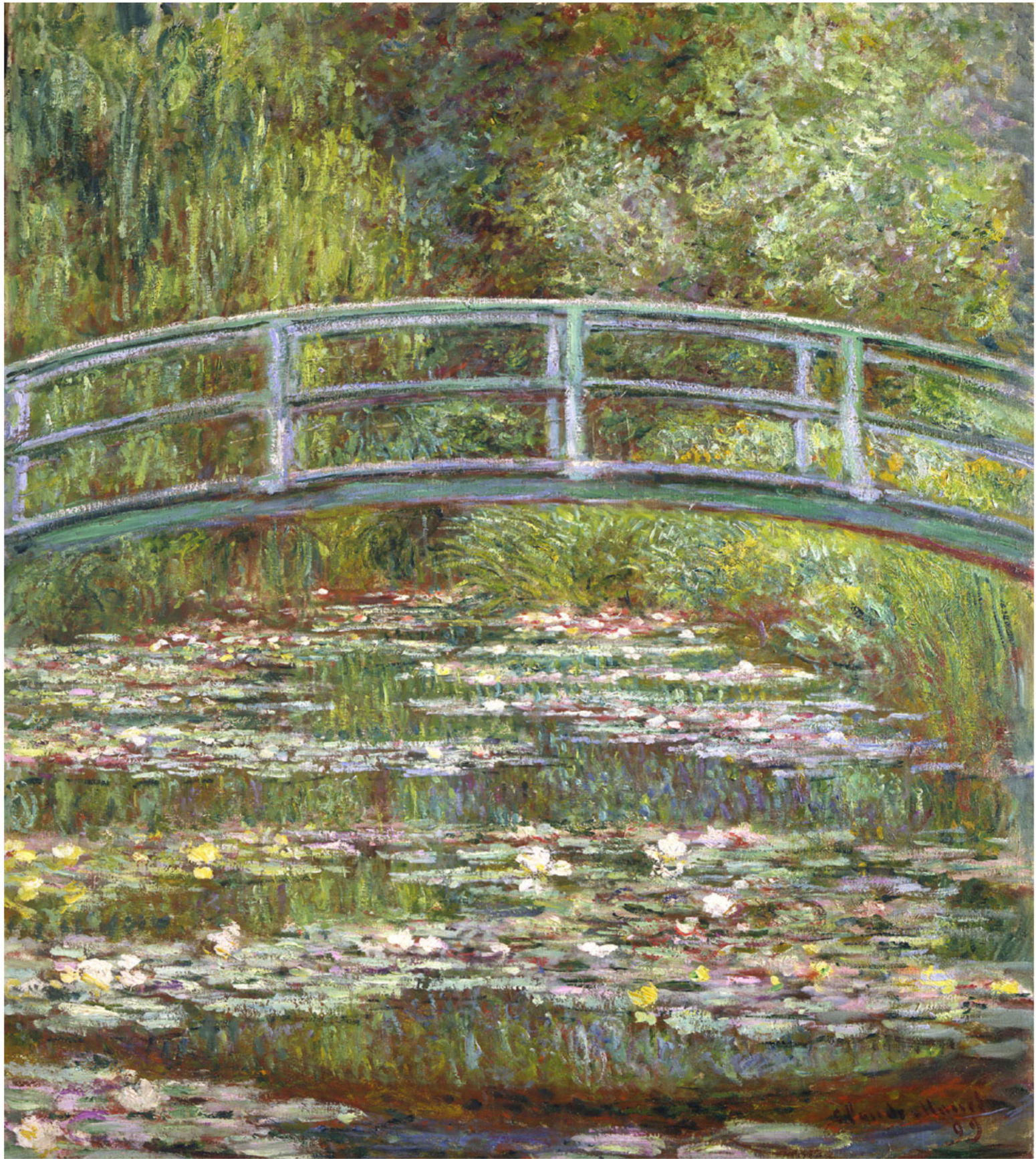
Näckrosdammen - Claude Monet